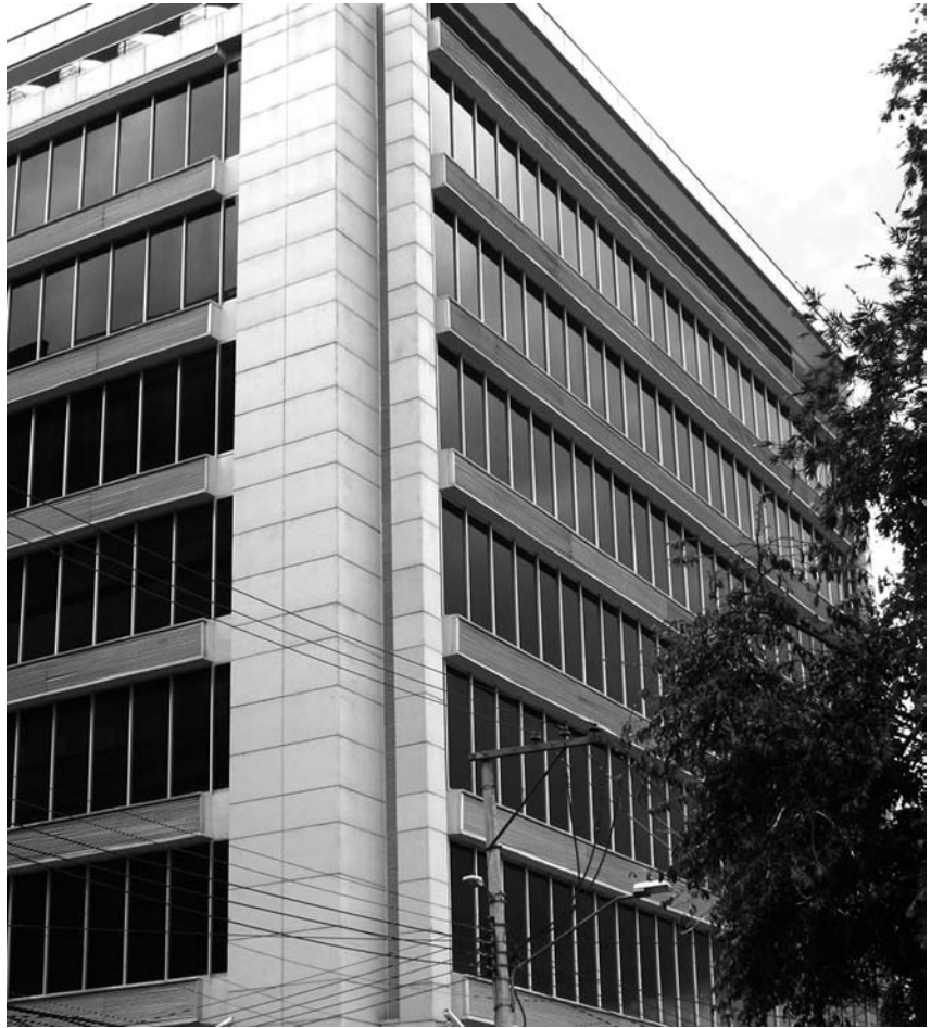
Arriba. Edificio Novartis